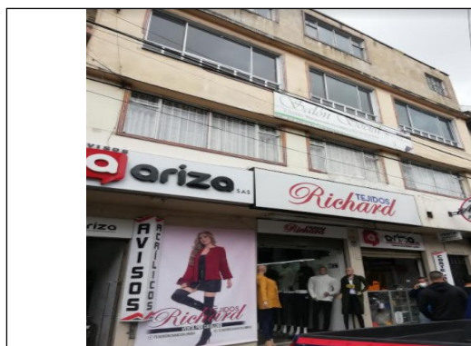
Fotografía No.1 Fachada del predio.