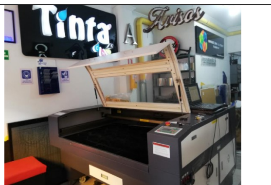
Fotografía No.3 Máquina de Corte Láser